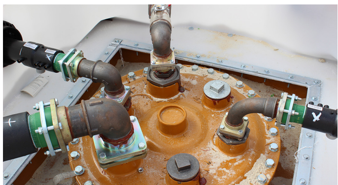
Exemple d'installation dans la chambre d'accès avec des tiges semi flexibles